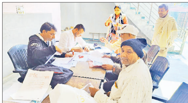
सोनीपत। सिक्का कॉलोनी में शिविर के दौरान नगर निगम कर्मियों को दस्तावेज जमा करवाते लोग।

नगर निगम क्षेत्र में पेयजल-सीवर कनेक्शन वैध कराने के लिए अब तक 1291 लोग अपने आवेदन जमा करवा चुका है। लोगों के पास 21 मार्च तक कनेक्शन वैध कराने का सुनहरा अवसर है। शहर में नगर निगम के अंतर्गत आने वाले विभिन्न वार्डों में पेयजल व सीवर कनेक्शन को वैध कराने की प्रक्रिया करीब दो माह से जारी है। नगर निगम ने बुधवार को सिक्का कॉलोनी स्थित लक्ष्मी नारायण मंदिर में विशेष शिविर लगाया। शिविर में 6 लोगों के पेयजल व सीवर कनेक्शन वैध कराने के लिए दस्तावेज जमा किए गए, जबकि मंगलवार को पटेल नगर में 9 लोगों ने अपने आवेदन जमा करवाए थे।