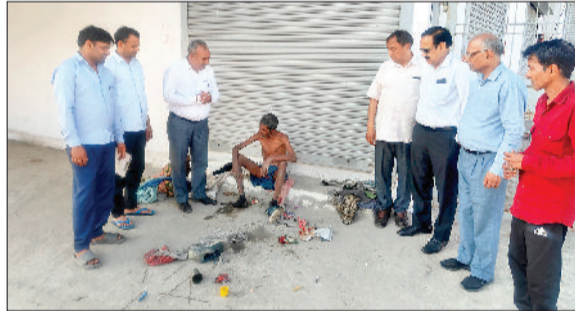
सोनीपत। बेसहारा व्यक्ति के साथ संस्था सदस्य।