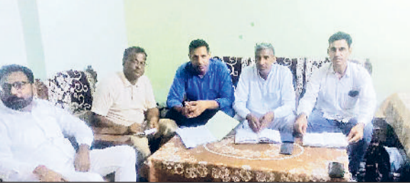
सोनीपत। बैठक कर विभाग के निदेशक के निर्देशों का रोष जताते हरियाणा विद्यालय अध्यापक संघ की जिला इकाई के पदाधिकारी।