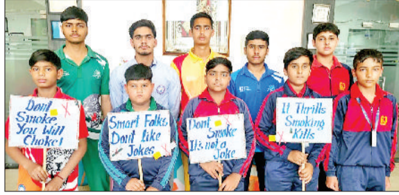
सोनीपत। ज्ञान गंगा ग्लोबल स्कूल के विद्यार्थी राष्ट्रीय धूम्रपान निषेध दिवस पर जागरूकता का संदेश देते हुए।