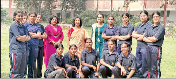
सोनीपत। हिंदू कॉलेज में आयोजित प्रतियोगिता में छात्राओं के साथ प्राचार्या एवं अन्य।