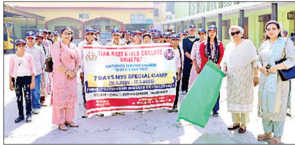
सोनीपत। शिविर का शुभारंभ के दौरान छात्राओं की रैली को रवाना करती प्राचार्या।